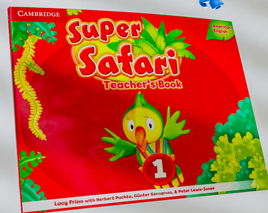
Super safari teacher's book: 1