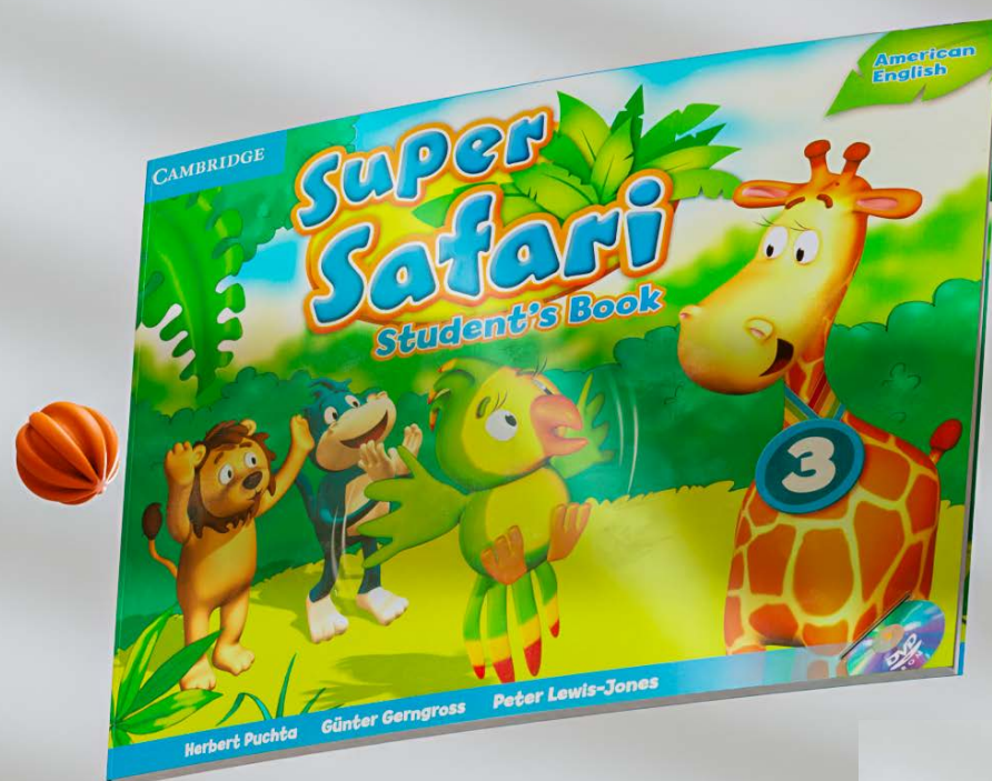
Super safari student's book: 3