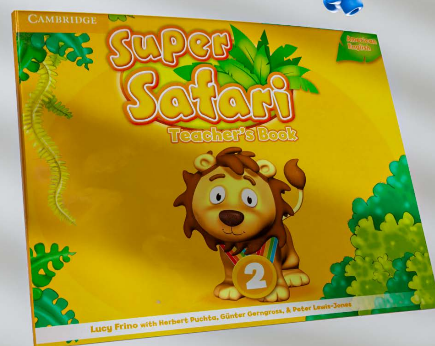
Super safari teacher's book: 2