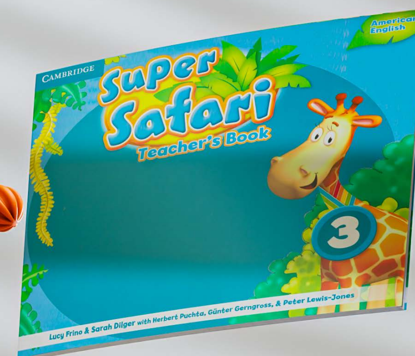
Super safari teacher's book: 3