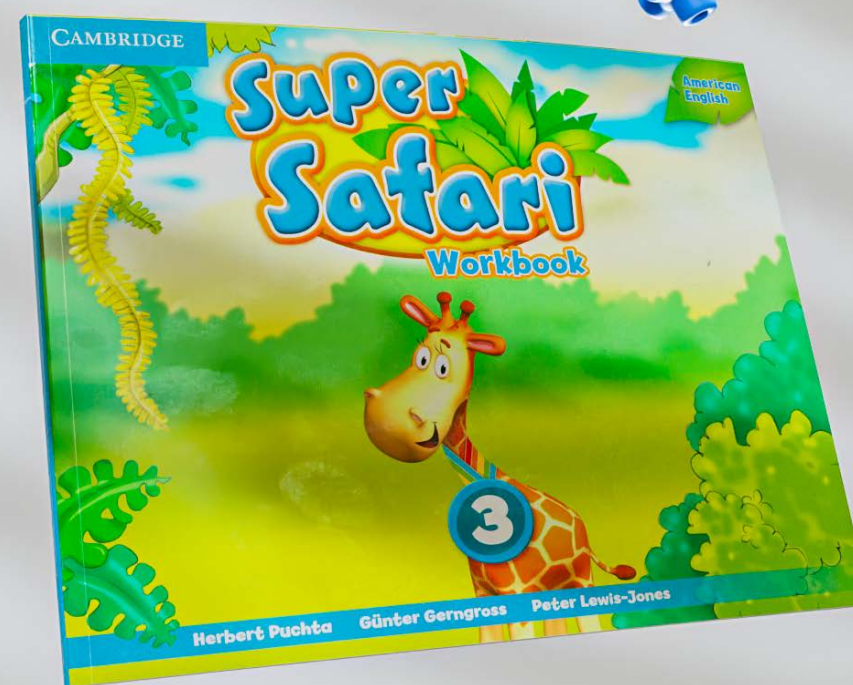
Super safari workbook: 3