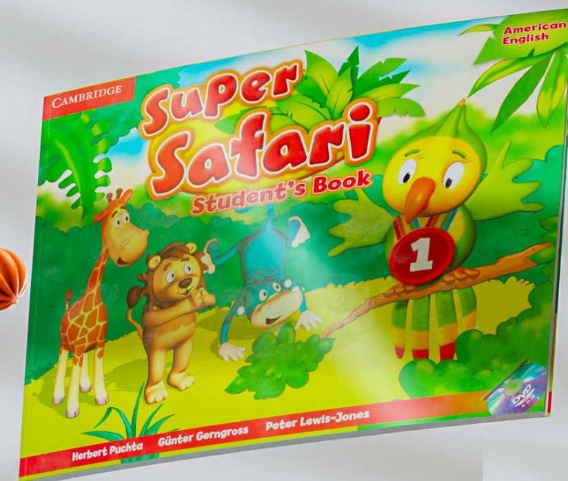
Super safari student's book: 1