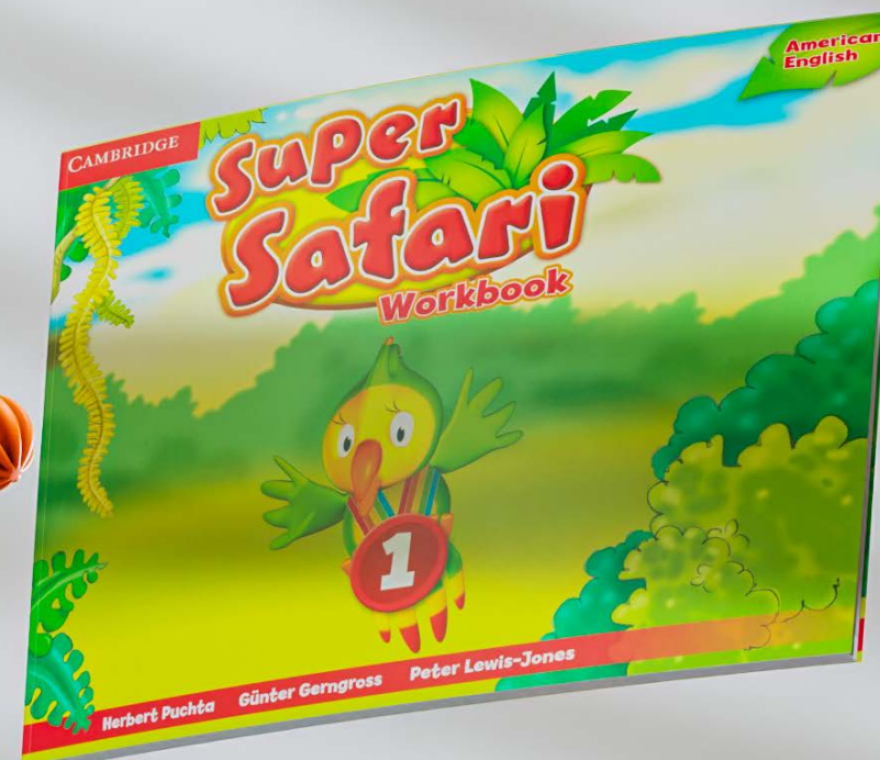
Super safari workbook: 1