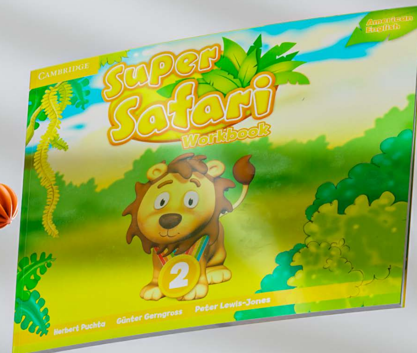
Super safari workbook: 2