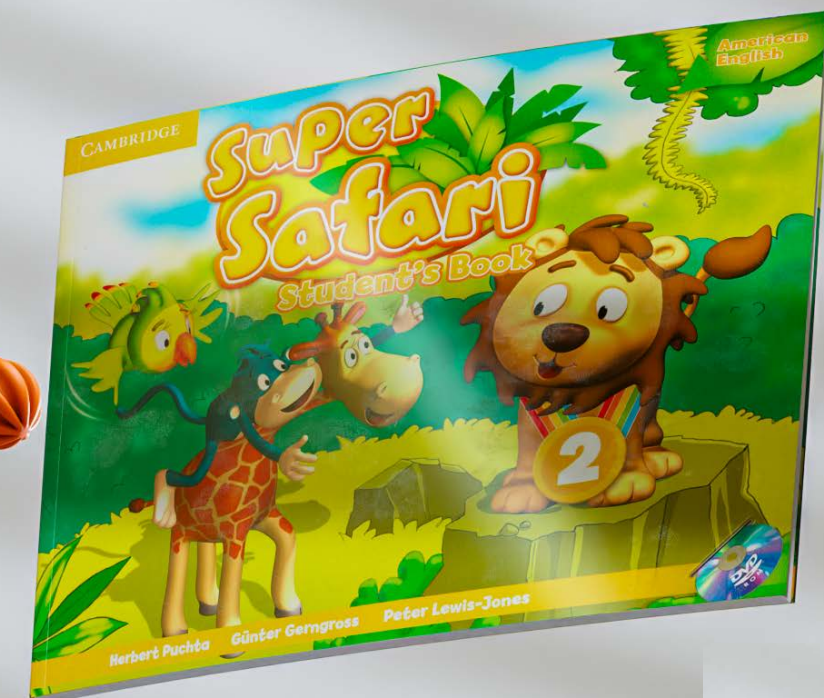
Super safari student's book: 2